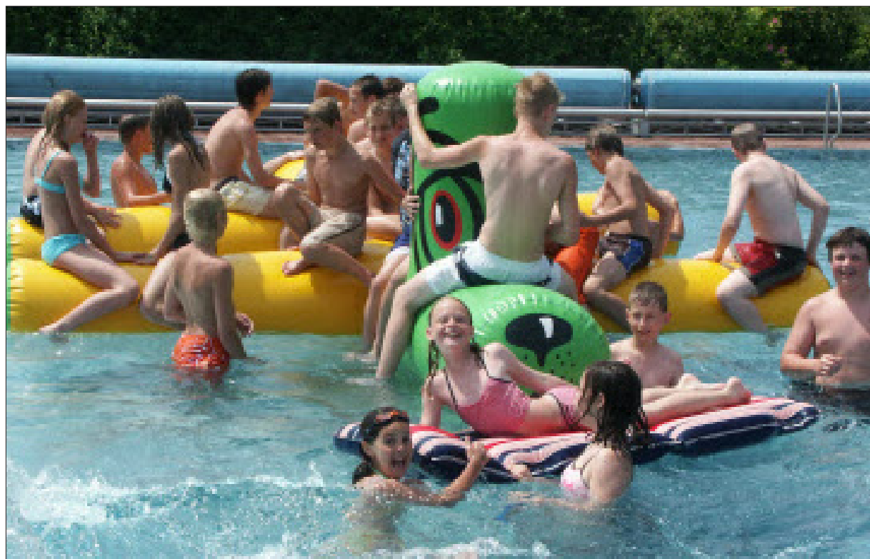
Plantschen mit dem Doggy-Tier: Im Erlebnisbecken fühlen sich die Kinder pudelwohl.

Jeden Tag hat das Freibade-Team die Gäste befragt und alle kommen, so Duschl, zum selben Resultat: Das Wasser ist klarer, die Haut riecht nicht mehr nach Chlor und wird weich ebenso wie die Haare – „auch die Schwimmbrille muss man nicht mehr reinigen, so gut Perlen die Wassertropfen ab“, hat der Schwimmmeister erfahren. Sein Gehilfe Robert Wagner berichtet von einem Ehepaar aus Deggendorf, das wegen