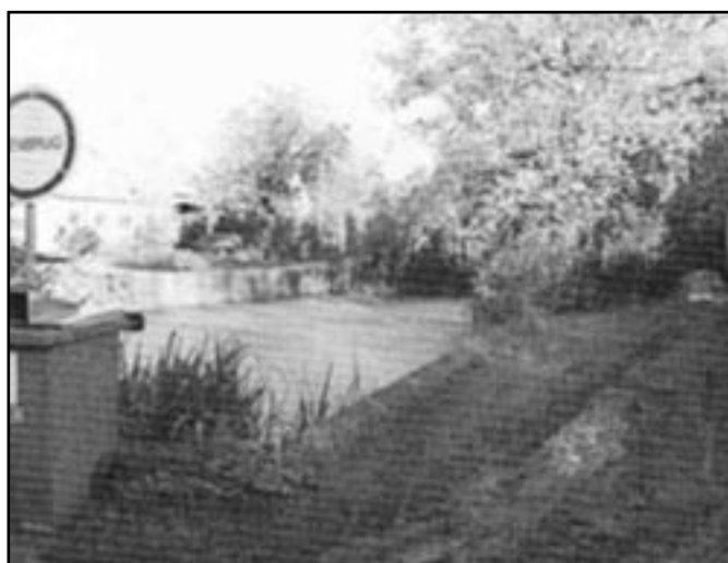
Under andemaden er vandet i Ørby gadekær krystalklart.

Skulle der være læsere, der er i besiddelse af mere kritisk materiale om Grander teknologi, vil avisen være glad for en orientering.