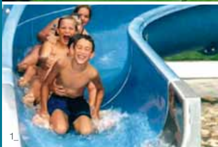
1_ Les jeux aquatiques : des moments joyeux partagés